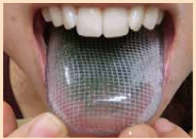
目からウロコの 舌パック (受講者全員)

日時 2018年10月14日(日)12:30～17:00 定員 22名 定員に満たない場合は、中止することがございます。あらかじめご了承下さい。 会場 デンタルヘルスアソシエート (東京都千代田区四番町8-1 東郷パークビル4F) 主催 相田化学工業株式会社 (東京都千代田区四番町8-1 東郷パークビル4F) TEL:03-6892-2331 FAX:03-3893-2370 受講料 歯科医師 36,720円 (税込) スタッフ 25,920円 (税込) 再受講 22,680円 (税込) TSO 25,920円 (税込) 協賛 株式会社 日本歯科商社 株式会社 トータルサポート OTA 対象 歯科医師・スタッフ ※スタッフの方と一緒に受講をおすすめ致します。 材料費込 今回より受講者 舌トレ実習 お申込方法 下記申込書にご記入の上、FAXにてお申し込み下さい。お申込みいただいた後、お振込先をご案内いたします。