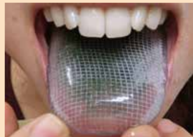
目からウロコの 舌パック

日時 2018年10月14日(日)12:30 ~ 17:00 定員 22名 定員に満たない場合は、中止することがございます。あらかじめご了承下さい。 会場 デンタルヘルスアソシエート (東京都千代田区四番町8-1 東郷パークビル4F) 相田化学工業株式会社 主催 デンタルヘルスアソシエート (東京都千代田区四番町8-1 東郷パークビル4F) TEL:03-6892-2331 FAX:03-3893-2370 受講料 歯科医師 35,640円(税込) 材料費込 スタッフ 24,840円(税込) 今回より受講者 再受講 21,600円(税込) 舌トレー実習 対象 歯科医師・スタッフ ※スタッフの方と一緒に受講をおすすめ致します。お申込方法 下記申込書にご記入の上、FAXにてお申し込み下さい。お申込みいただいた後、お振込先をご案内いたします。